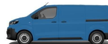
BLEU 758 - A4V