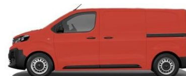
ROUGE FEU – RAL 3000 064 - A4Q