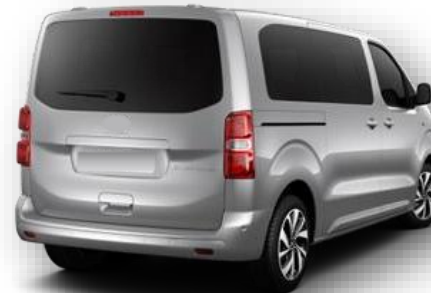
FHO - Hayon vitrat