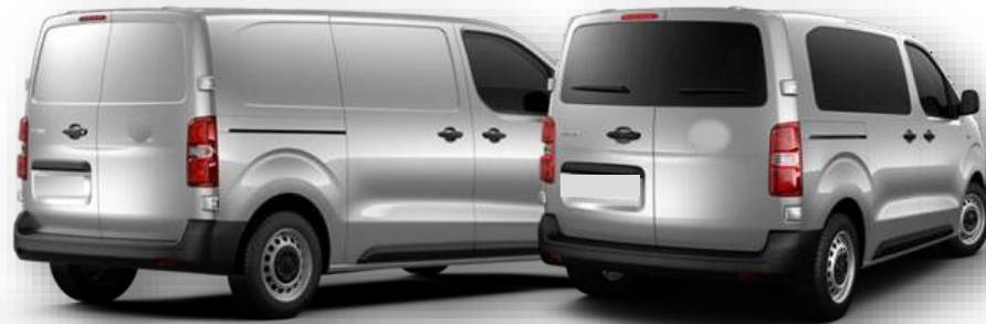
Uși spate batante tip panou