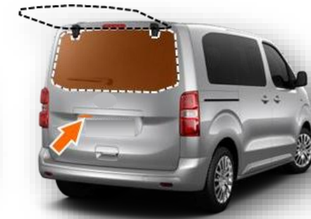
FHP - Hayon vitrat cu geam spate cu deschidere