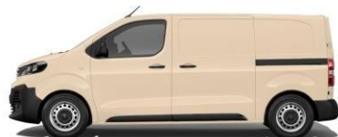
BEIGE TROPIC – RAL 1015 841-A4U