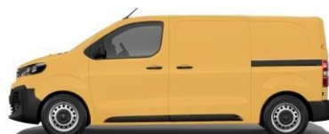
JAUNE OR – RAL 1004 070 - A4S