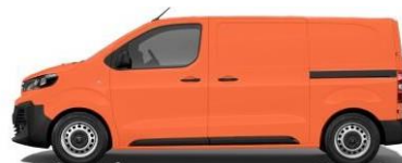
ORANGE – RAL 2011 065 - JFW