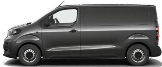
COLLOSEO GRI 125 – AY6