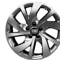
FJ7 – Jante din aliaj ușor 17”