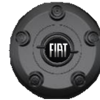
FJ0 – Jante din aliaj 16”