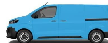
POSTNORD BLUE 013 - CNA