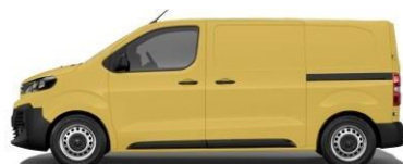
JAUNE GENET – RAL 1032 259 - A4R