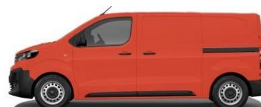
ROUGE POSTE 143 - AQP