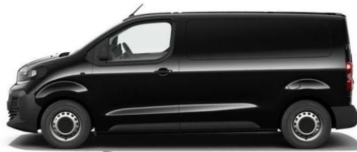
CINEMA- BLACK 632 – 5DP