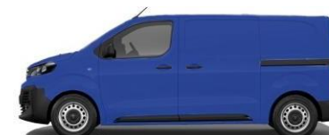
BLEU EDF – RAL 1987 067 - A4P