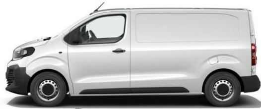
GELATO WHITE 549 – 5DL