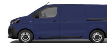
BLEU 455 - A4T