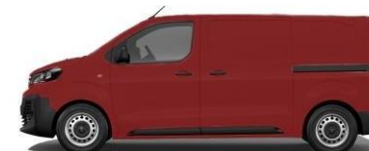
ROUGE ARDENT 182 - A4D