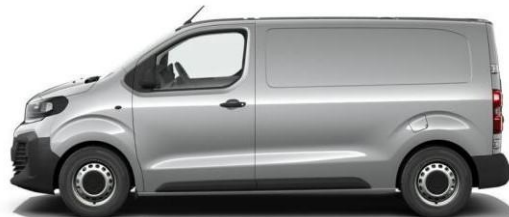
MAESTRO GRI 861 – 5DN