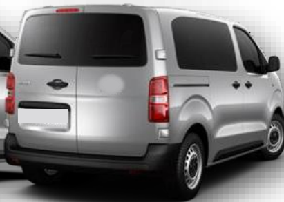
FHN - Uși spate batante vitrate