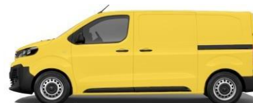
GALBEN – RAL 1023 545 - J03